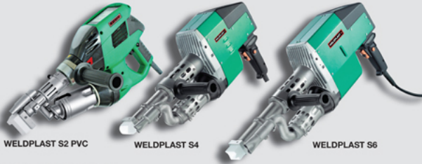
WELDPLAST S2 PVC