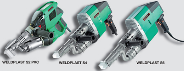
WELDPLAST S2 PVC